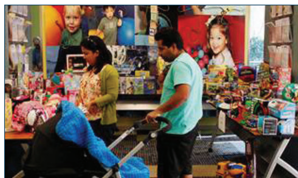
Durante las citas programadas en el FRC Comfort Connection, los padres seleccionaron regalos gratuitos que fueron luego envueltos por voluntarios, mientras que Santa Claus entretenía a los niños.

El pasado mes de diciembre casi 600 familias de bajos ingresos a las que sirve el RCOC disfrutaron de días festivos más brillantes gracias a la generosidad de numerosas personas, organizaciones comunitarias y empresas. El programa Wish Tree, organizado por voluntarios que son empleados del RCOC, cumplieron los deseos de las fiestas de 323 consumidores de todas las edades, mientras que el programa del Centro de Recursos para Familias Comfort Connection (FRC) del RCOC dio regalos para las fiestas a 264 niños de 127 familias a las que sirve el Programa de Intervención Temprana.