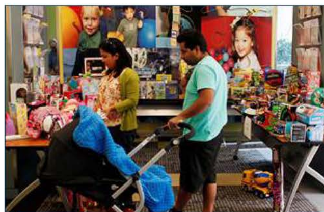
Trong các buổi hẹn được sắp đặt trước tại FRC của Comfort Connection, các bậc cha mẹ đã lựa chọn các quà tặng miễn phí, sau đó được gói giấy đẹp bởi các tình nguyện viên, trong khi con cái của họ được chơi với ông già Noel Santa Claus.